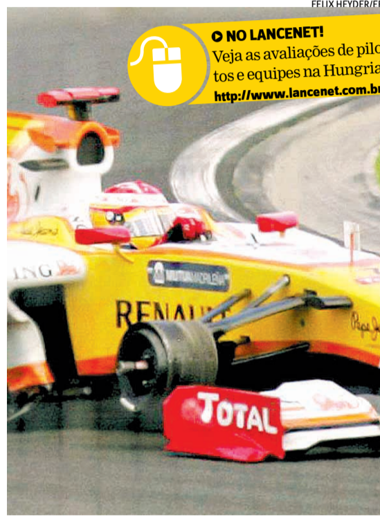
Roda solta tirou Alonso da prova e rendeu punição à Renault